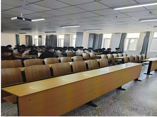
前排空座现象依然存在

从开学第二天起，教学秩序与教学环境出现逐步下滑趋势，一日不如一日，具体表现如下：