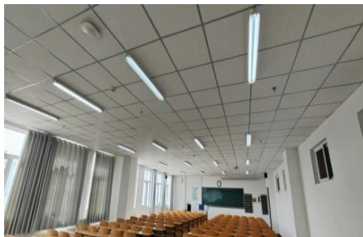
教室没有课程安排，但灯火通明

1、少数教室出现前几排无人就座的现象，督导老师发现后，当即要求任课教师现场予以纠正；