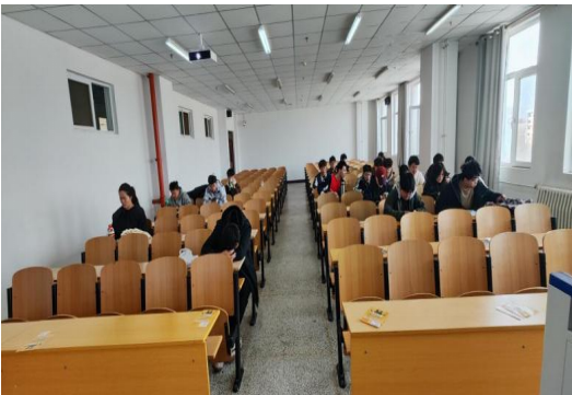
某教室，应到 81 人，实到 20 人